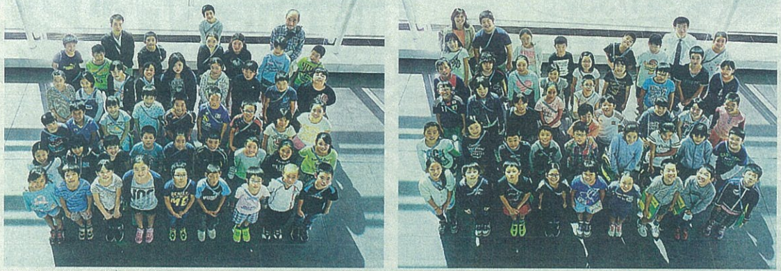
静岡市立井宮小学校(5年生88人、引率4人)

ことを受けて開催。現在の公共施設389棟のうち今後20年で全施設の延べ床面積を2014年度比20%削減を目指している。